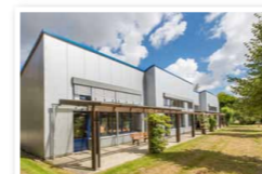
31234 Edemissen Am Berkhöpen 3