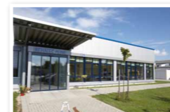
31226 Peine Werner-Nordmeyer-Str. 26

Wir sind zertifiziert nach DIN EN ISO 9001:2015