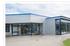
31303 Burgdorf Holzwiesen 1